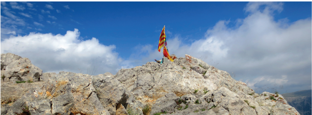
Pedraforca (2.506m) des de Gósol

Si la pujada se'ns fa molt feixuga sempre podem observar les escarpades parets i canals que tenim a la nostra esquerra (N), on a vegades hi fa acte de presència l' isard , sol o en ramat. Passem una petita pineda, veritable oasi enmig d'un desert petri, amb un parell de rampes força dures, i seguim la nostra diagonal fins que sortim al pintoresc coll de Pradell , des d'on ja tenim l'Enforcadura a tocar. Des d'aquest coll estant enfilem les darreres rampes, molt dures, fins que advertim que el pendent se suavitza i assolim la llegendària 3 Enforcadura (2:45h - 2.356m) , collada natural que uneix els dos Pollegons i que fa del Pedraforca un massís tan especial i atractiu. Especialment si és un dia festiu ens sobtarà molt la gentada que passa per aquest coll: són els excursionistes que pugen per la via clàssica del Verdet o per la tartera de Saldes. Des d'aquí podem veure la diferència entre el Pollegó Inferior (E-SE), que ens queda a la nostra dreta, i el Pollegó Superior (N-NO), que ens queda a l'esquerra. Coronar el Pollegó Inferior requereix fer una escalada. En canvi, el Pollegó Superior ofereix un punt feble, una canal força àmplia que ens permetrà pujar-hi sense córrer gairebé cap risc.