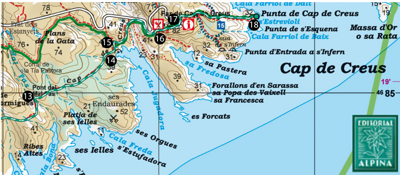
Cap de Creus. 1:25.000. Editorial Alpina.