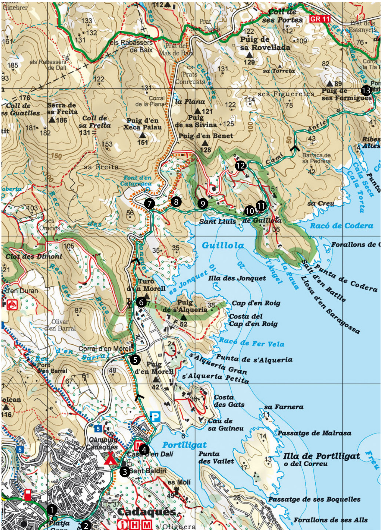
Camí Antic de Cadaqués al Cap de Creus