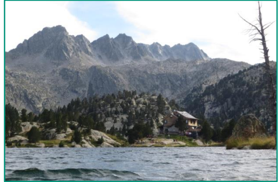
Refugi JMBlanc i cresta de l'Aviò al fons.