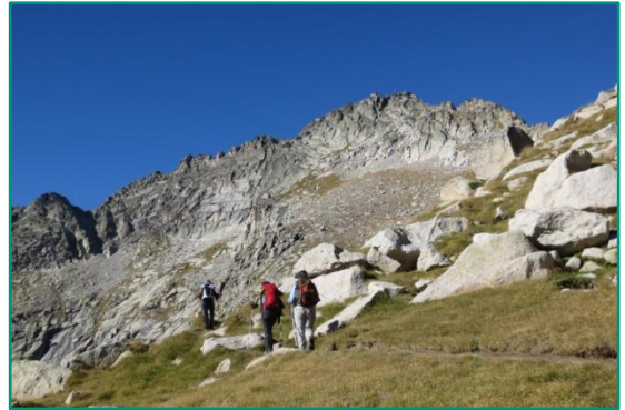
Pujant cap al coll de Monestero amb el pic de Peguera al fons.