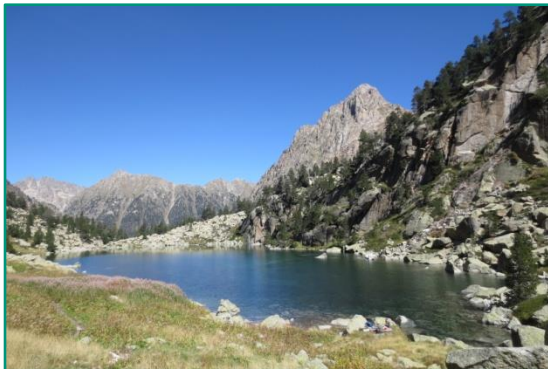
Estany de Monestero.