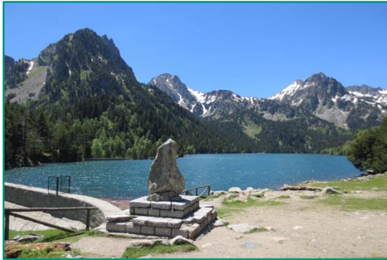
Estany de Sant Maurici.