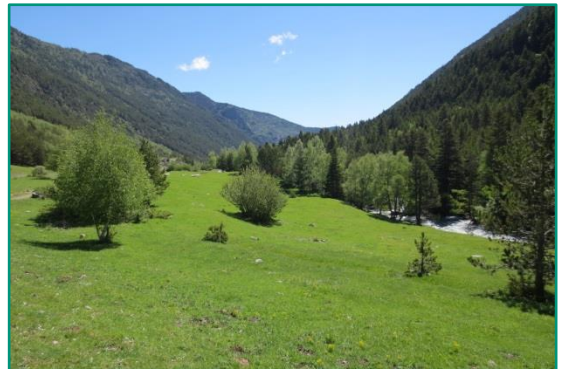
La vall del riu Escrita.