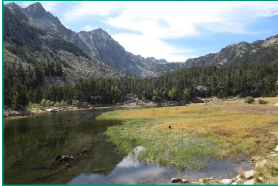
Estany de Lladers.